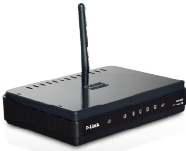
Obr. 1 - Domácí brána D-Link DIR-600